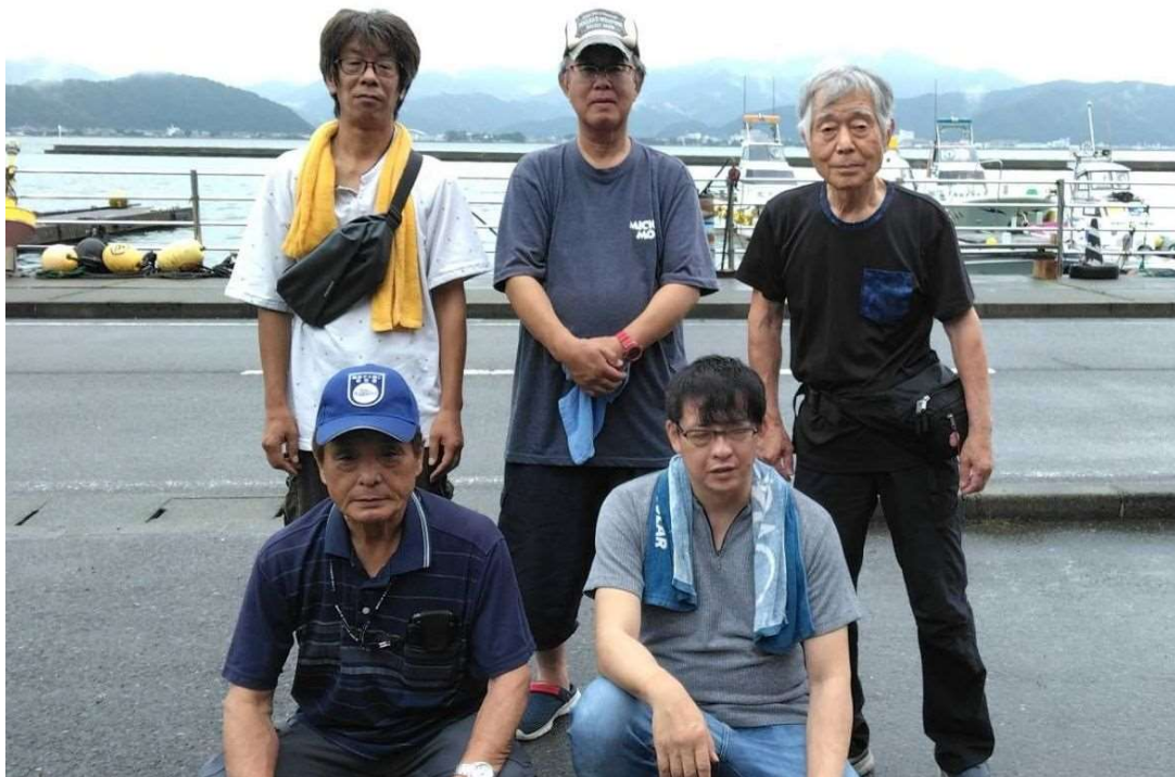
福井県小浜市仏谷 大住渡船 記念写真